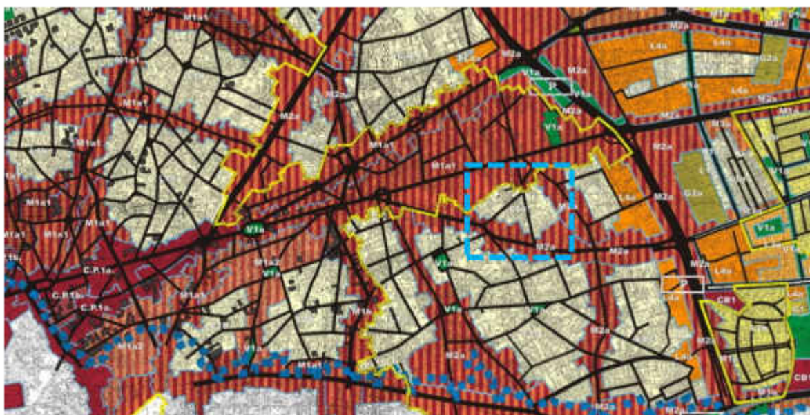
P.U.Z. Sector 2, Bucuresti, aprobat cu H.C.L.S.2. nr. 99/2003, in prezent expirat